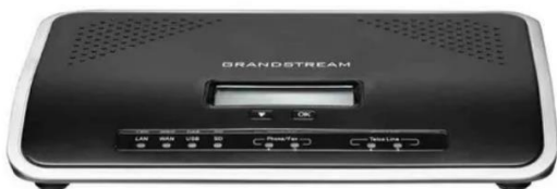
Imagen 10. 8