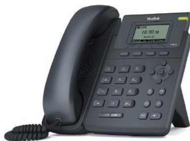
Imagen 8 – Yealink.com 6