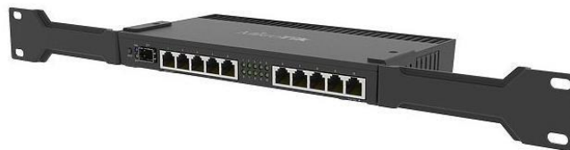
Imagen 4: Router