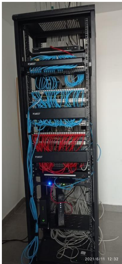
Imagen 11: Rack con la instalación y los equipos de red