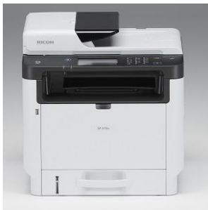
Imagen 6: Impresora Ricoh 3720