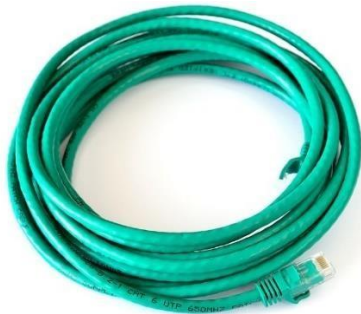
Imagen 1. Cable categoría 6A