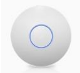
Imagen 5: Unifi.com 3