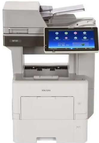
Imagen 7: Impresora Ricoh MP 501 5