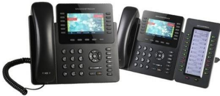
Imagen 9. – Grandstream.com 7