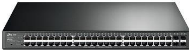
Imagen 3: switch – tplink.com